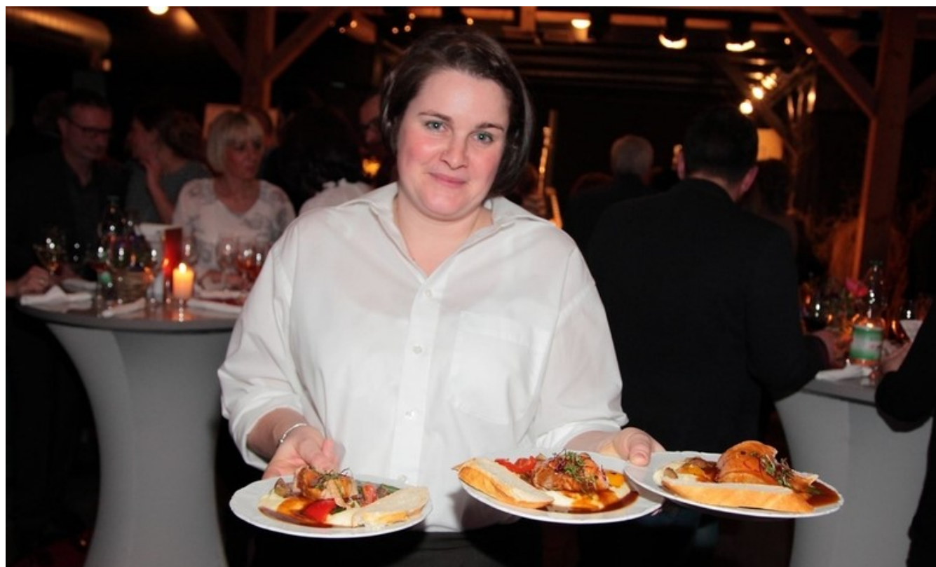
Die Gerichte waren in Perfektion auf den Punkt zubereitet und mindestens so hübsch angerichtet wie wohlschmeckend. Foto: Pfeifer

SCHWANDORF. Schlemmen für den guten Zweck hieß es am Samstagabend. Zur edlen Wohltätigkeitsgala „Kunst & Kulinaria“ zeigte sich der Sperl-Stadl in Fronberg von seiner glamourösesten Seite. Die Mischung aus blues-rockiger Musik von der Rattle Gang und einem Feinschmecker-Vier-Gänge-Menü von der Schwandorfer Hufschmiede lockte über 100 Gäste nach Fronberg.