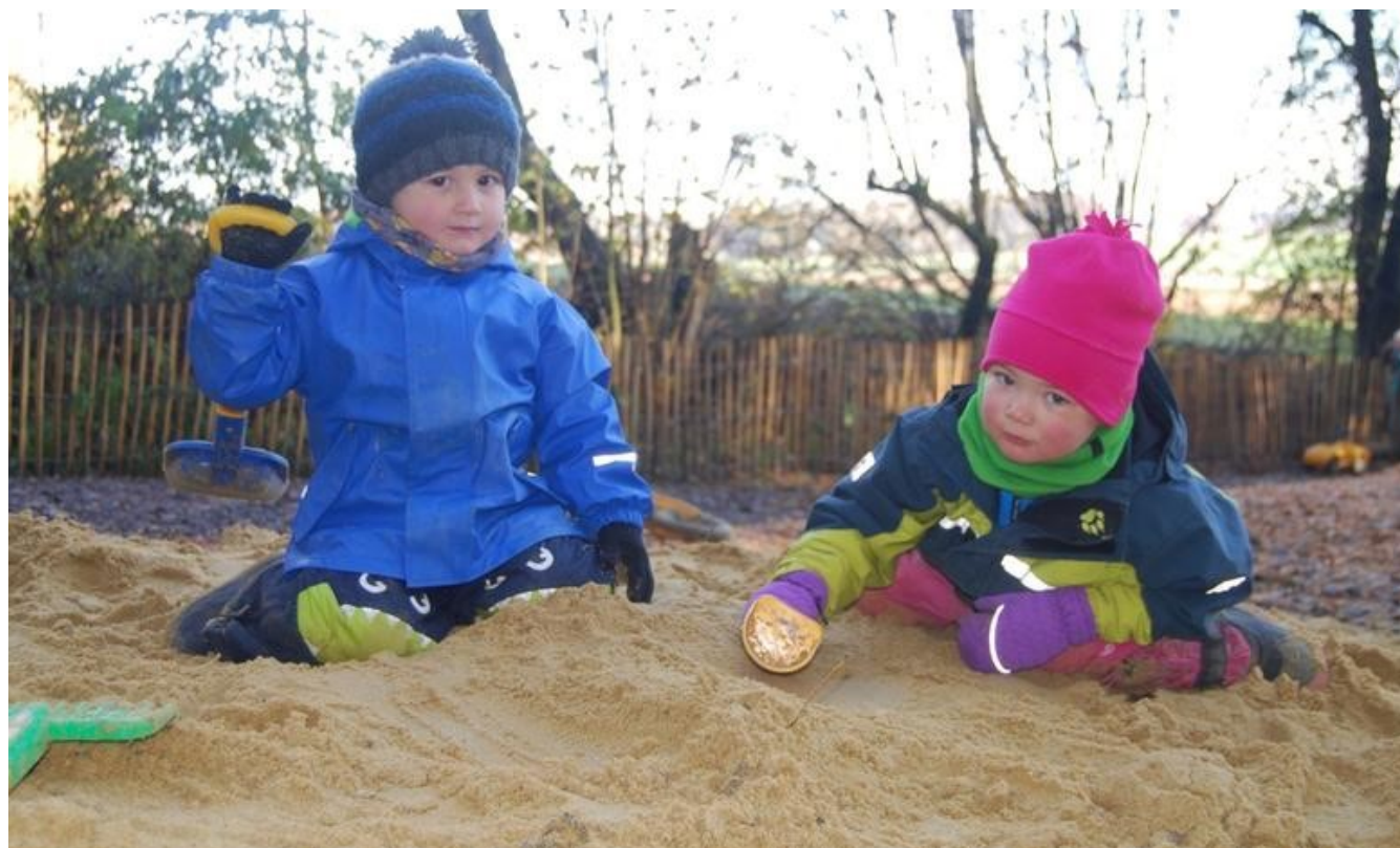
Warm eingepackt spielen Lenox und Paula auf dem großen Sandhaufen. Im Waldkindergarten fühlen sie sich mittlerweile längst heimisch.

SCHWANDORF. Lenox und Paula klettern auf dem Sandhaufen herum und graben mit ihren bunten Schaufeln ein Loch ums andere. Damit sie nicht frieren, sind sie warm eingepackt: Ohne Schneehose, Handschuhe, Schal und Mütze geht im Moment nichts im Waldkindergarten „Schwanenkinder“ in Richt. Den Kleinen macht aber selbst Schmuddelwetter nichts aus – und auch die Eltern sind vom